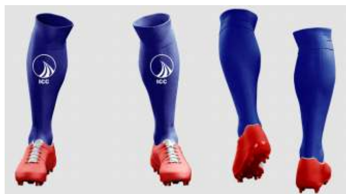
Meião, uniforme alunos (futsal)