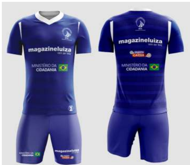
Camiseta e bermuda, uniforme alunos (futsal)