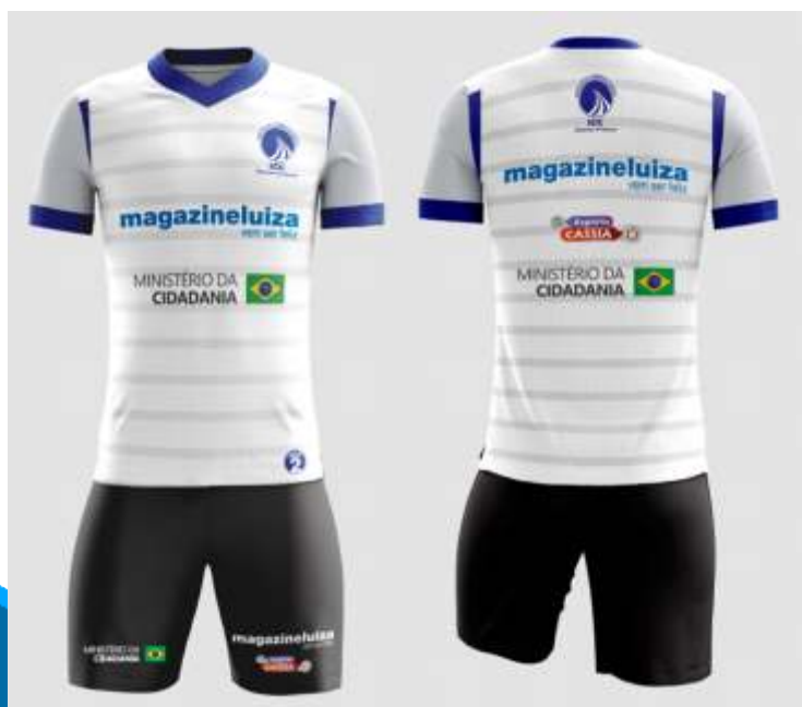
Camiseta e bermuda de aula (RH)